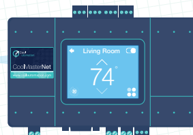
Универсальный HVAC Шлюз