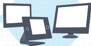
Система Умный Дом/BMS